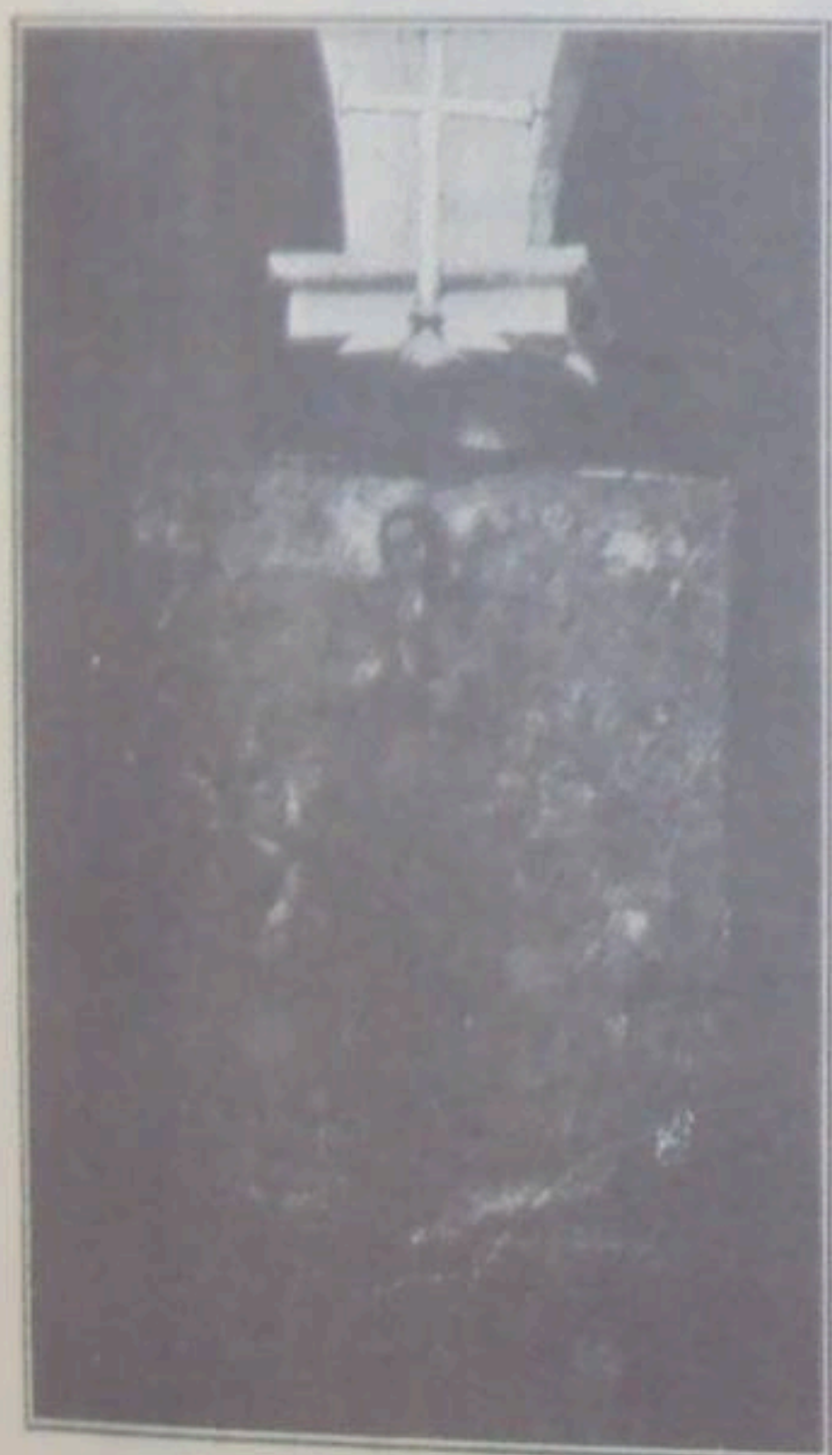
Uma bandeira antiga da Irmandade da Misericórdia

privilegio de salvar da morte os que, indo a enforcar, partiam com o peso do corpo a corda homicida; passavam farricocos vestidos de roxo com cordas á cinta e pés descalços. E tudo era lento e silencioso; sómente, de onde a onde, se ouvia taramelar o estrondoso ruge-ruge, chamando á penitencia os que não tinham ainda