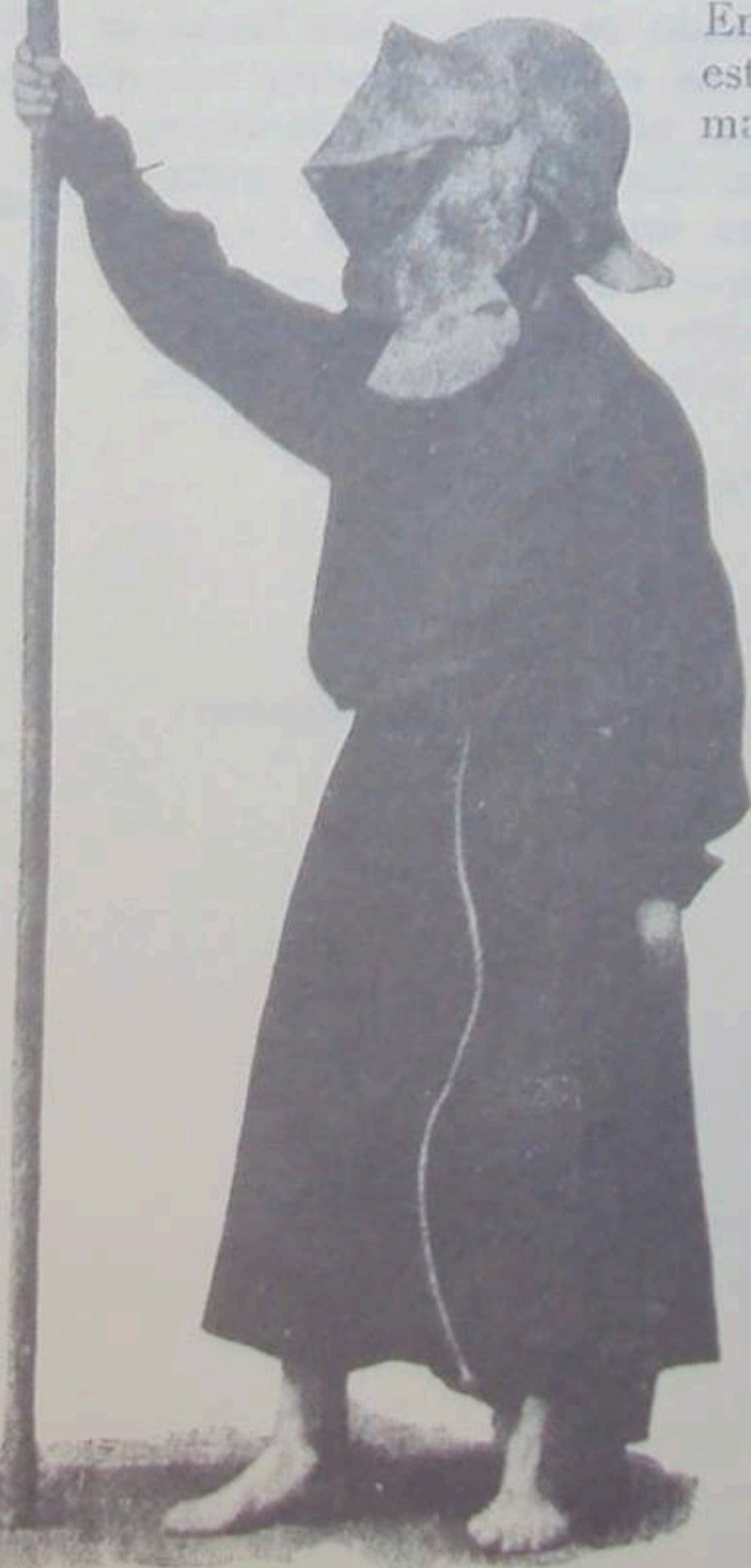
Homem com o fogaréu